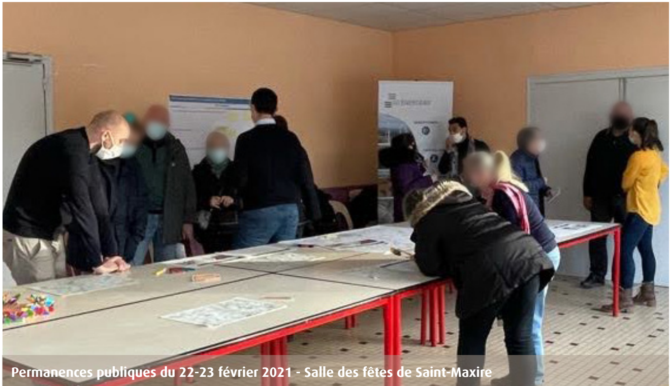
Permanences publiques du 22-23 février 2021 - Salle des fêtes de Saint-Maxire

COMPTE RENDU DES PERMANENCES PUBLIQUES SUR RENDEZ-VOUS DU 22 ET 23 JANVIER 2021